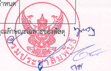
ตารางที่ 1 เปรียบเทียบคุณสมบัติข้อกำหนด ขอบเขตของงานหรือรายละเอียดคุณลักษณะเฉพาะของพัสดุ